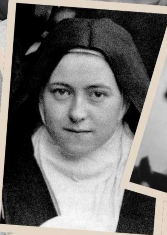
Santa Teresa de Jesús